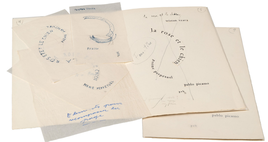
PAB, essais autographiques et épreuve typographique pour la page de titre de La Rose et le chien , annotée par Tristan Tzara (BnF, Réserve des livres rares, RES 4-Z PAB ED-27). fig. 7